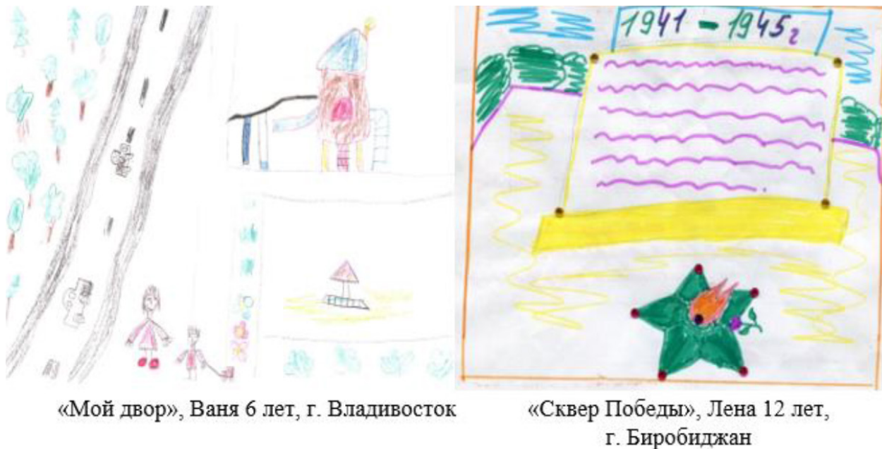
Рис. 5. Детские рисунки городских объектов, 2019 г.

места ты когда-нибудь посещал? Куда бы тебе хотелось пойти одному? Где бы тебе хотелось находиться сейчас? Что из запрещенного родителями тебе удавалось делать? На какую самую большую высоту ты когда-нибудь залезал? Куда ты идешь, чтобы побыть одному? А чтобы побыть с друзьями? Какую самую глупую вещь ты когда-нибудь совершал? Какие игры ты придумаешь?»