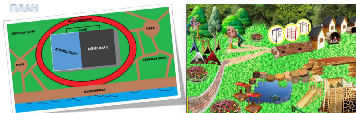
Рис. 1. Проект плана микс-парка (авторы: Ермаков Марк, Нагорный Ярослав, Грищенко Дарья, 8 «А», 2016 г.)

«Я и дело» среди семиклассников-лицеистов (54 человека) в городе Владивостоке. На протяжении месяца командами детей разрабатывались собственные инициативные решения. Проектная деятельность включала несколько последовательных этапов: