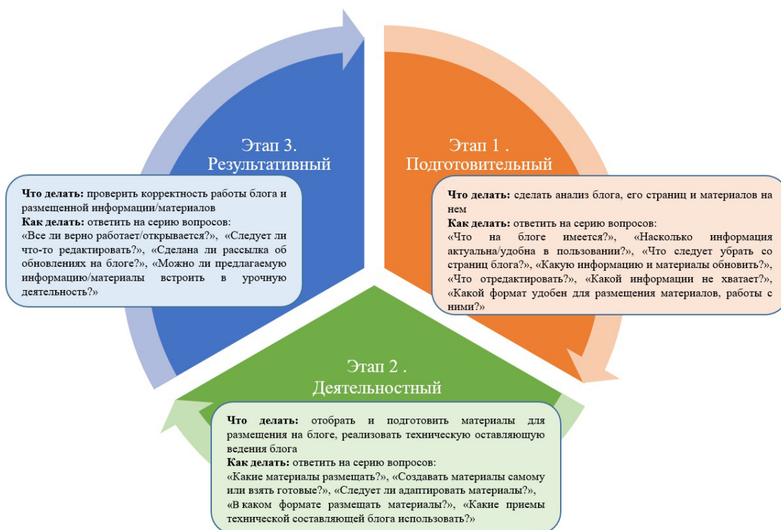
Рис. 1. Цикл педагогического блоггинга