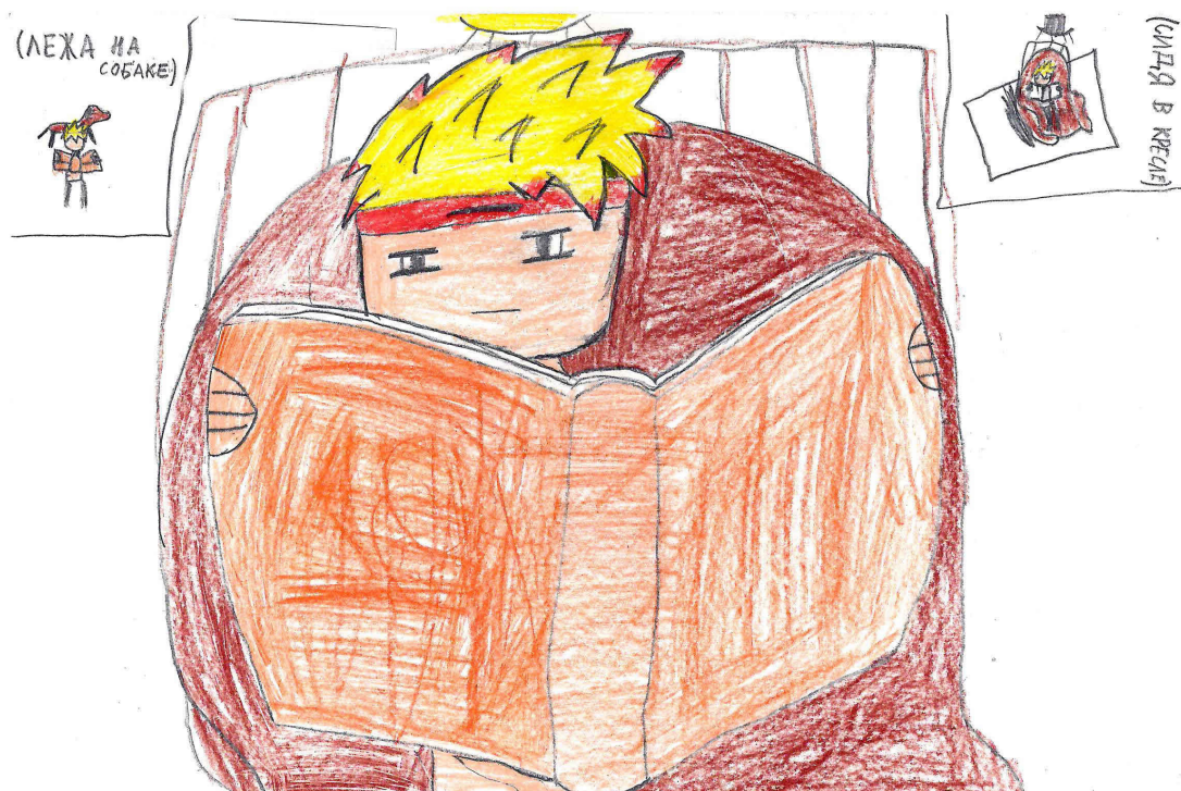
Рис. 3. Автор рисунка— Роман (11 лет, Краснодар)