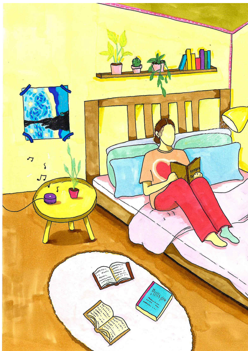
Рис. 1. Автор рисунка — Виктория (12 лет, Краснодар)

Далее приведена таблица (табл. 1), из которой видно, какие места для чтения были изображены на рисунках.