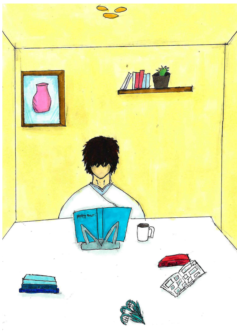
Рис. 2. Автор рисунка— Эмилия (12 лет, Краснодар)

У девочек на рисунках — более детальное изображение атрибутов, в том числе можно увидеть картины, цветы, большее количество мебели в помещении. Книжки есть на всех рисунках, однако книжных полок изображено мало в тех комнатах, где ребенок читает, всего на двух рисунках. Это подтверждает общую тенденцию к отказу в домах от личных библиотек. За последние 15 лет сократилось количество семей, в домах которых есть домашние библиотеки — с 84,9% в 2006 г. до 69% в 2021 г. (Колосова 2021).